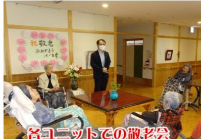
各ユニットでの敬老会