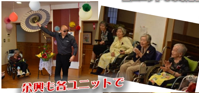
余興も各ユニットで

今年度の敬老会は、新型コロナウイルス感染症予防のため 全体ではなく各ユニットにて開催し、余興やお弁当等で 細やかながらお祝いさせていただきました。 ご家族様を御招待することができず、心苦しい限りですが 入居者様には喜んで頂くことができました。