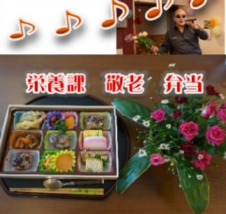
栄養課 敬老 弁当