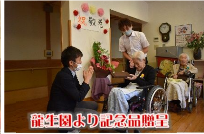
龍生園より記念品贈呈

今年度の敬老会は、新型コロナウイルス感染症予防のため 全体ではなく各ユニットにて開催し、余興やお弁当等で 細やかながらお祝いさせていただきました。 ご家族様を御招待することができず、心苦しい限りですが 入居者様には喜んで頂くことができました。