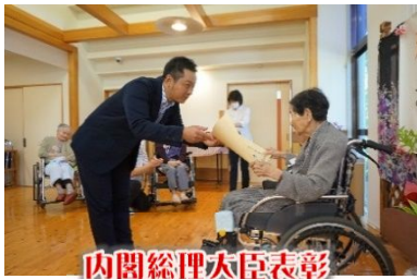
内閣総理大臣表彰